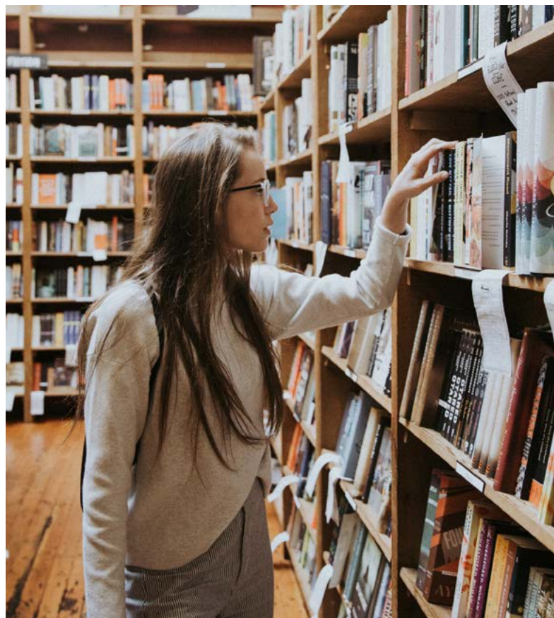
Joven estudiante.

Los modelos europeos están en parte inspirados por los modelos de estados de bienestar estudiados por el sociólogo Gosta Esping-Andersen. 22 En Europa se han identificado y consolidado cuatro modelos de emancipación de la población joven –nórdico, continental, anglosajón y mediterráneo–, basados en las diferentes trayectorias educativa, laboral, residencial y familiar. 23