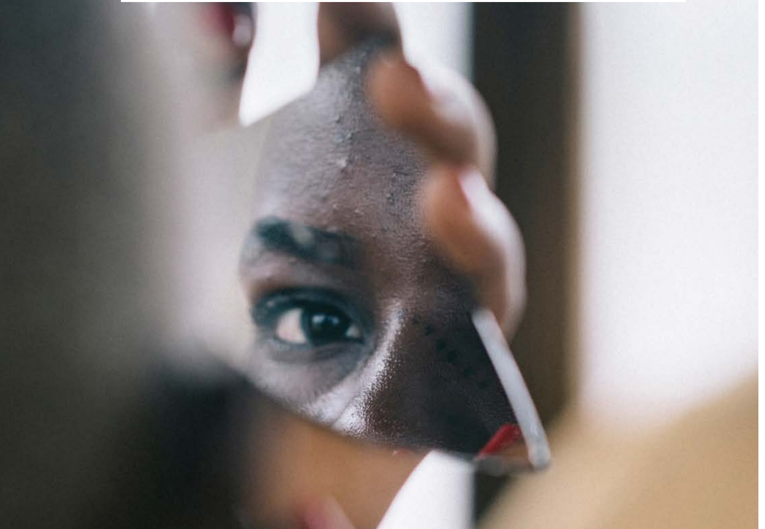
Joven en el espejo.

Por lo que respecta a la salud juvenil, las dificultades durante el proceso de emancipación se multiplican en África y Latinoamérica. Estos incluyen: enfermedades venéreas, embarazos no deseados, abortos inseguros, mayor mortalidad en el parto, afectación de la salud mental y emocional, o sufrir las consecuencias de un conflicto o de la violencia callejera. El homicidio para un joven latinoamericano es treinta veces más probable que para un joven europeo. 66 Y, sin embargo, en ciertos contextos centroamericanos, la violencia puede convertirse en una trayectoria de emancipación (Recuadro 4). La violencia es sin duda motivo de huida, de expulsión, forzando "autonomías", especialmente en el caso de las mujeres. Es causa tanto de desplazamientos internos, en el propio país, como en el entorno urbano, donde las personas se repliegan hacia un lugar privado reconfigurándolo, haciéndolo colectivo- y abandonan el espacio público.