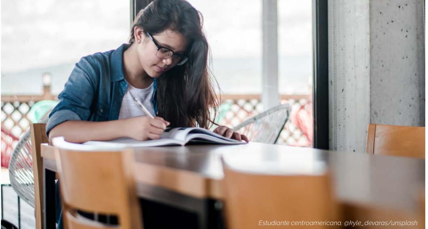
Estudiante centroamericana.