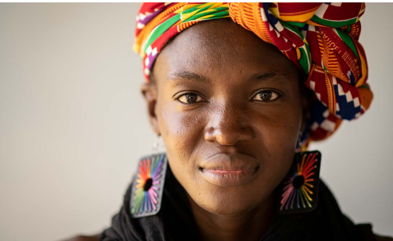
The Sahel Superheroes, Oxfam.