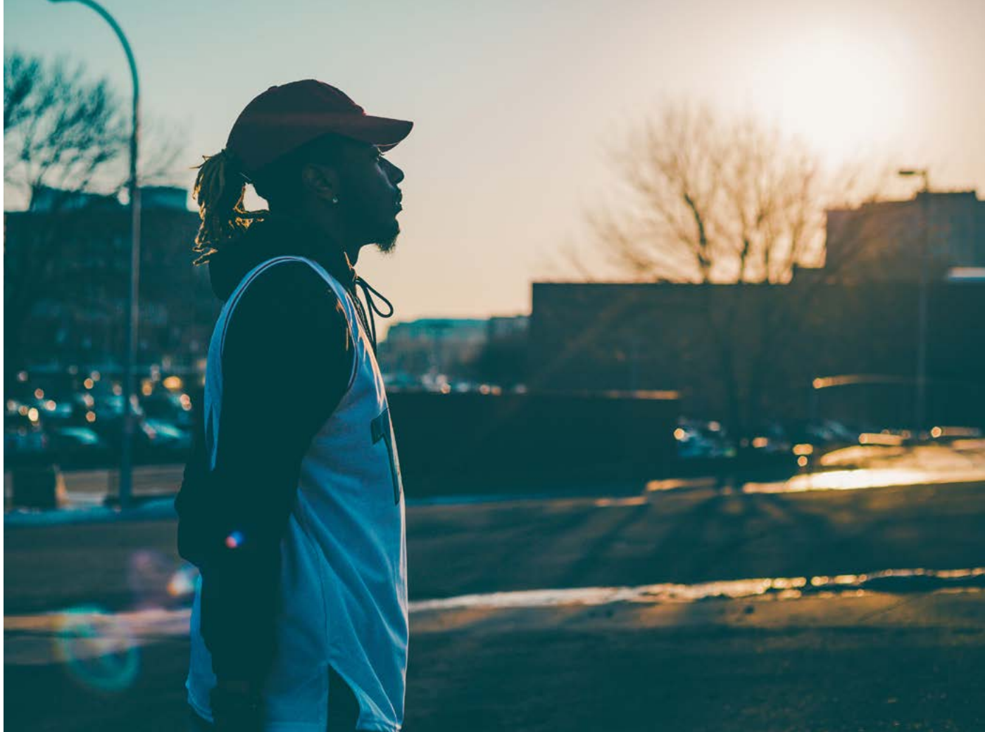
Joven afroamericano.