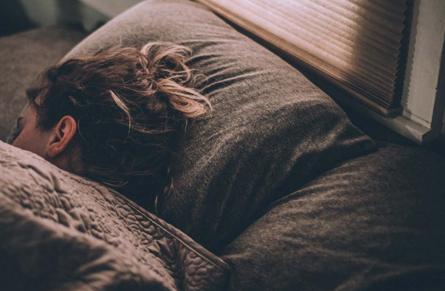
Joven durmiendo.

desarrollo de servicios públicos y de protección social, no se espera socialmente un retorno económico por parte de las hijas e hijos. Por el contrario, en países africanos y latinoamericanos de renta baja, las personas jóvenes apoyan a menudo a sus familiares mientras se emancipan. Y si las familias extensas toman ese rol de apoyar en estos contextos, ahí sí existe la expectativa de que la persona joven retorne ese apoyo. En países con grandes necesidades socioeconómicas y gobiernos con una respuesta de protección social limitada, la juventud ejerce este rol, vía cuidados directos y/o apoyo económico. Este patrón se repite con la población inmigrante que envía remesas. Es lo que investigadoras como Samantha Punch distinguen como "independizarse" e "interdependizarse", sugiriendo que el primer término es más aplicable a contextos europeos más individualizados. 104