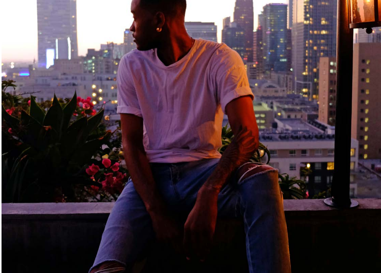
Joven latinoamericano.

para la opción de negocio propio era la necesidad de inversión, mientras que la falta de contactos o "redes" limitaba la entrada al sector formal. A pesar de los estudios, "quienes conocen a los grandes hombres siempre consiguen el trabajo", decía un joven de 22 años entrevistado en dicho estudio. 72