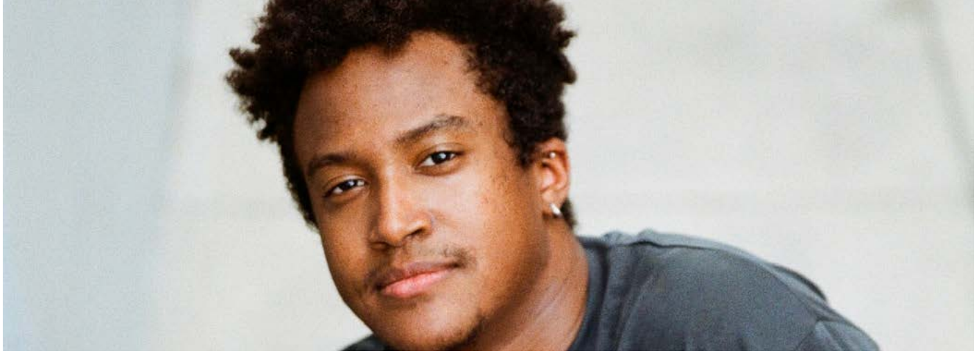
Joven latino.

porque en Barcelona los pisos son más caros. En Lleida me cuesta mucho encontrar trabajo y de momento estoy viviendo del paro de los últimos años trabajados y alquilo una de las habitaciones del piso. (Grupo personas migradas y racializadas, Lleida, 2021).