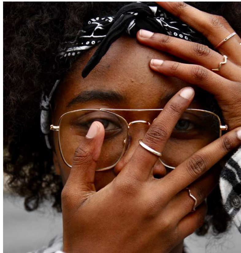
Retrato joven.

En África, existen estudios que han identificado patrones regionales desde las trayectorias educativa, laboral y familiar. El modelo de África del Oeste se caracteriza por una escolarización básica con retos generalizados tanto en el acceso como en la calidad y permanencia educativa. La trayectoria educativa es corta en relación a la media global, puesto que la mayoría de jóvenes que estudian finalizan sus estudios al acabar primaria, o secundaria. El ingreso a la trayectoria laboral, mayoritariamente en el sector informal, se produce a edades tempranas. 13 El sector informal representa el 89% de la economía en los países del África subsahariana, con África del Oeste ostentando el porcentaje más alto del continente (92%). 14 La formación de una familia propia también se produce a edades tempranas, sobre todo en mujeres (16 años), y el periodo entre tener pareja y tener hijas/os es corto. 15 Esta trayectoria familiar es compartida por otros países africanos de renta baja en África del Este y del Sur.