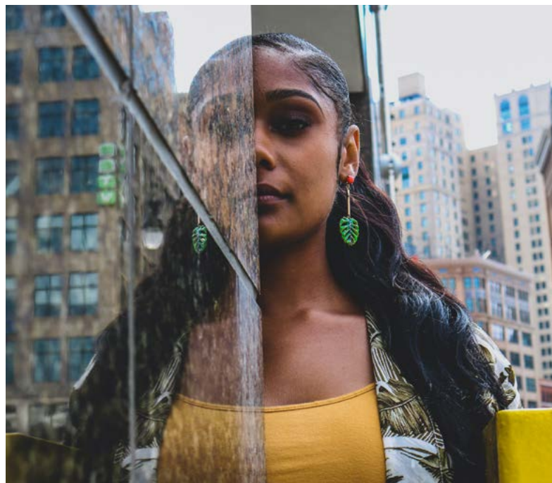
Dona llatinoamericana.

El continent llatinoamericà presenta diferències notables en les seves trajectòries d'emancipació juvenil entre països de renda mitjana i baixa, entre classes altes i baixes, i entre zones rurals i urbanes.