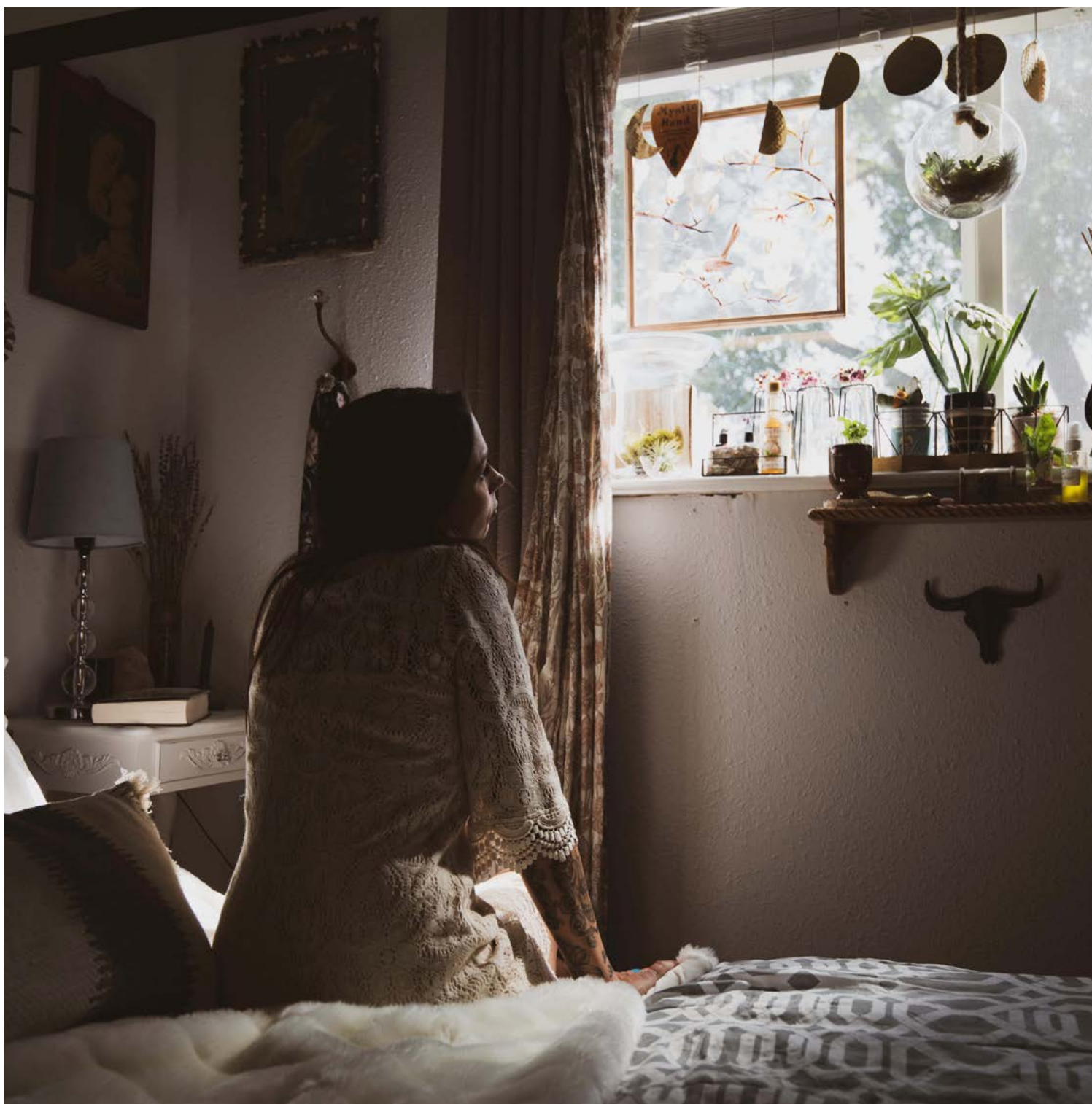
Jove en el seu dormitori.

emancipacions juvenils. L'informe inclou algunes conclusions i recomanacions finals.