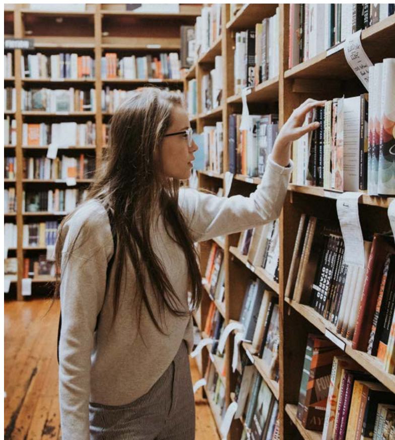
Jove estudiant.

Els models europeus estan inspirats en part pels models d'estats de benestar estudiats pel sociòleg Gosta Esping-Andersen. 22 A Europa s'han identificat i consolidat quatre models d'emancipació de la població jove –nòrdic, continental, anglosaxó i mediterrani–, basats en les diferents trajectòries educativa, laboral, residencial i familiar. 23